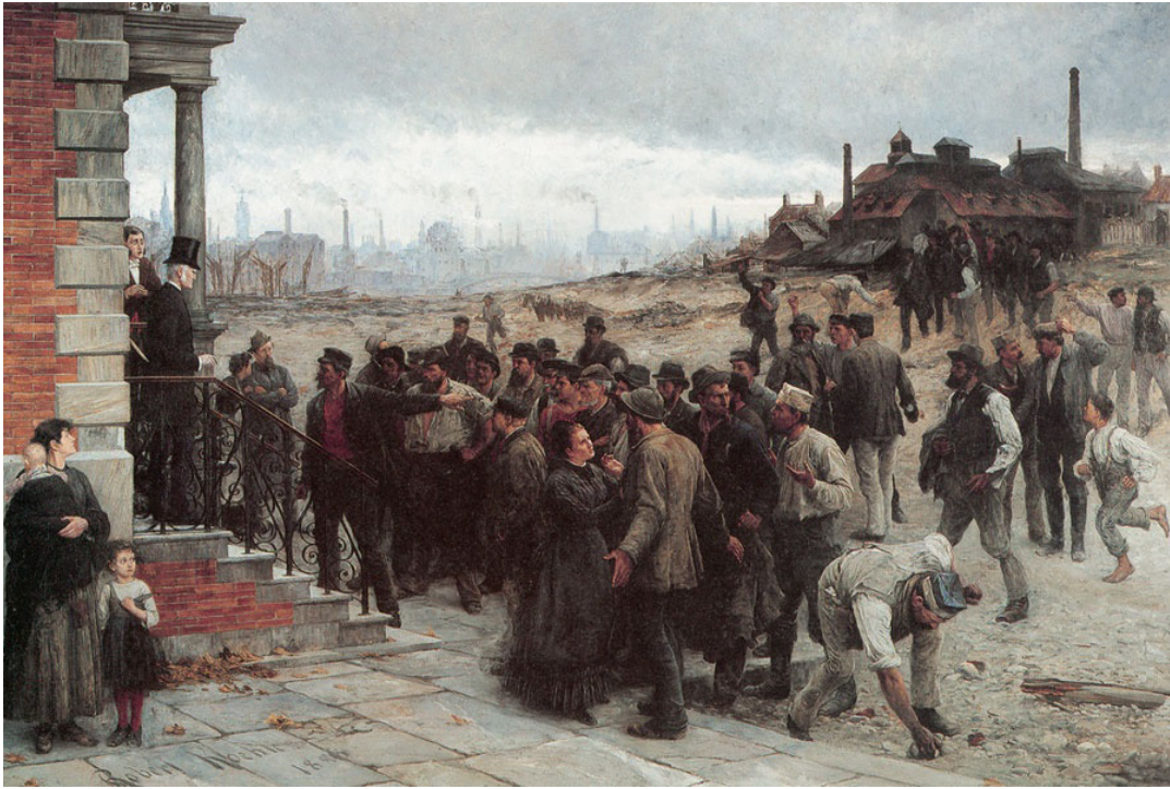
Staat und Kirche, konfrontiert mit der Sozialen Frage.