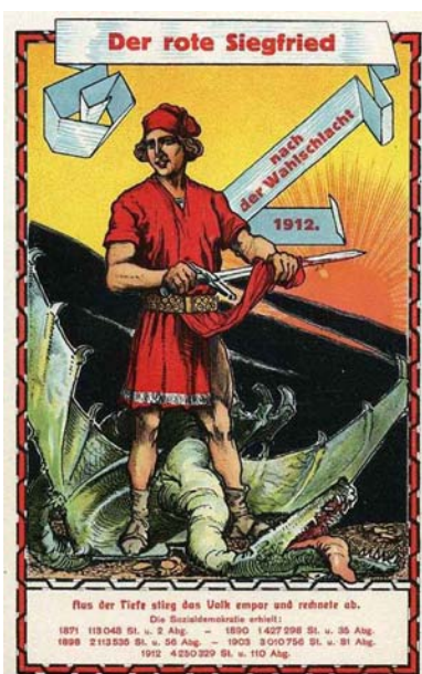
Postkarte der SPD. Die SPD wurde 1912 stärkste Fraktion. In Anspielung auf die Sagenfigur „Siegfried der Drachentöter“ erscheint nach der Reichstagswahl 1912 der „rote Siegfried“, der den „konservativen Drachen“ zur Strecke gebracht hat.