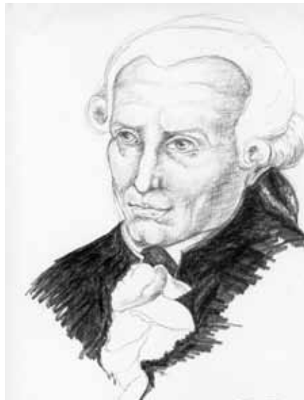
Immanuel Kant, 1724 bis 1804

Wir treten mit unserer Betrachtung ein in die politisch und geistesgeschichtlich hochdramatische Zeitspanne von 1776, dem Jahr der AMERIKANISCHEN REVOLUTION, bis zum Untergang des alten „HEILIGEN RÖMISCHEN REICHES DEUTSCHER NATION“ im Jahre 1806, der FRANZÖSISCHEN REVOLUTION 1789 und der neuen Errichtung einer dynastischen Ordnung