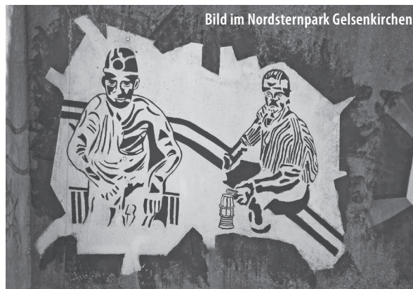
Bild im Nordsternpark Gelsenkirchen

Es bestand also enormer Handlungsdruck für die Herrschenden. Aber trotz dieser Krise schien eine andere wirtschaftliche Entwicklung erst mal nicht